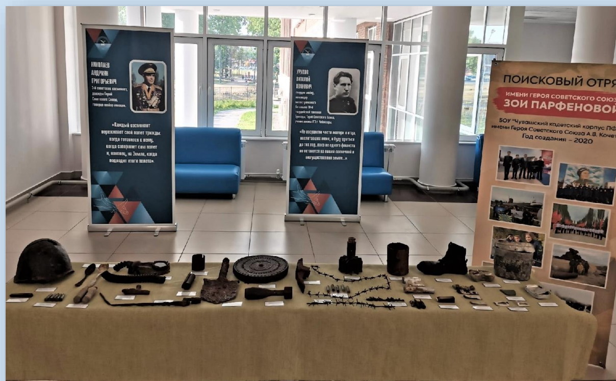
Выставочная площадка Республиканской августовской конференции педагогических работников