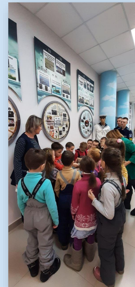
ДОУ «Детский сад № 146» г. Чебоксары