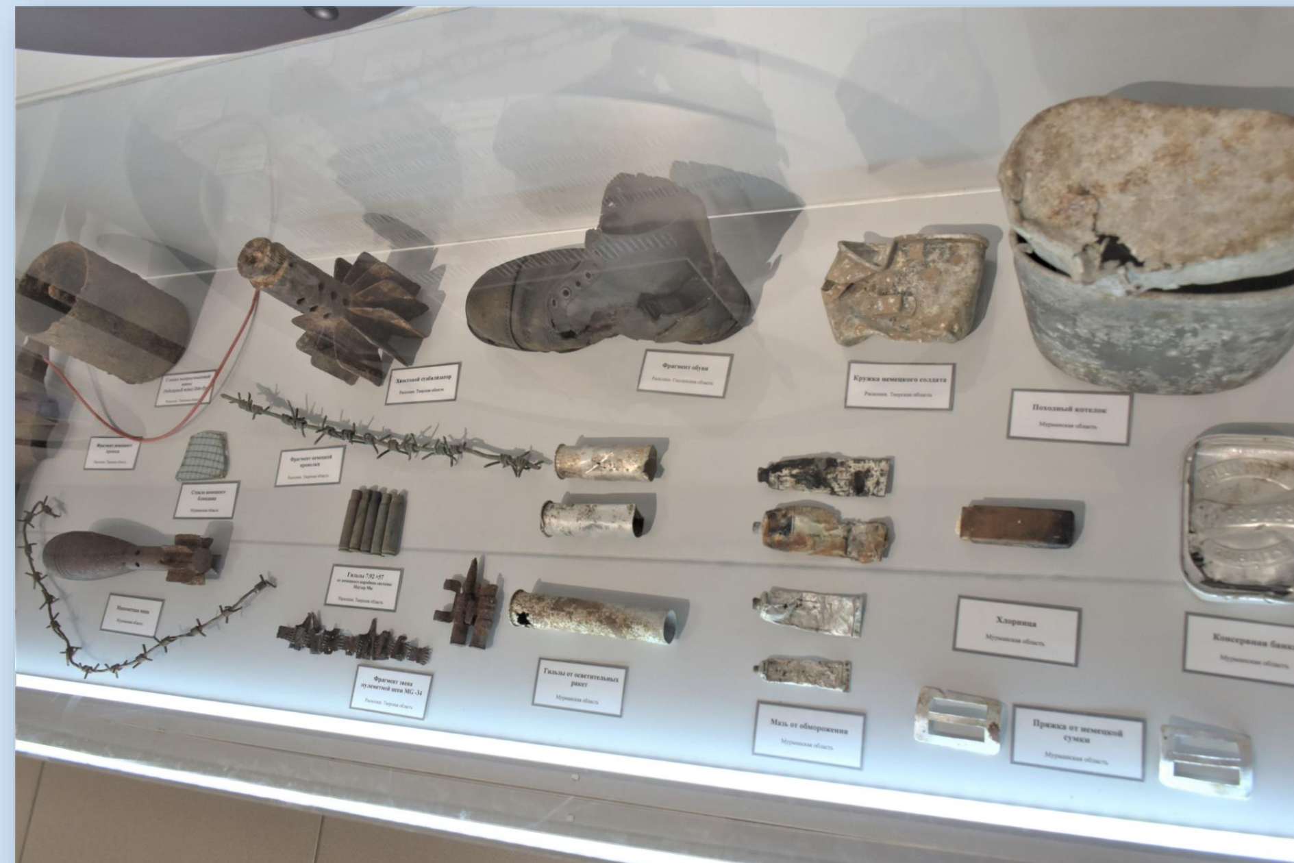
Артефакты времён Великой Отечественной войны