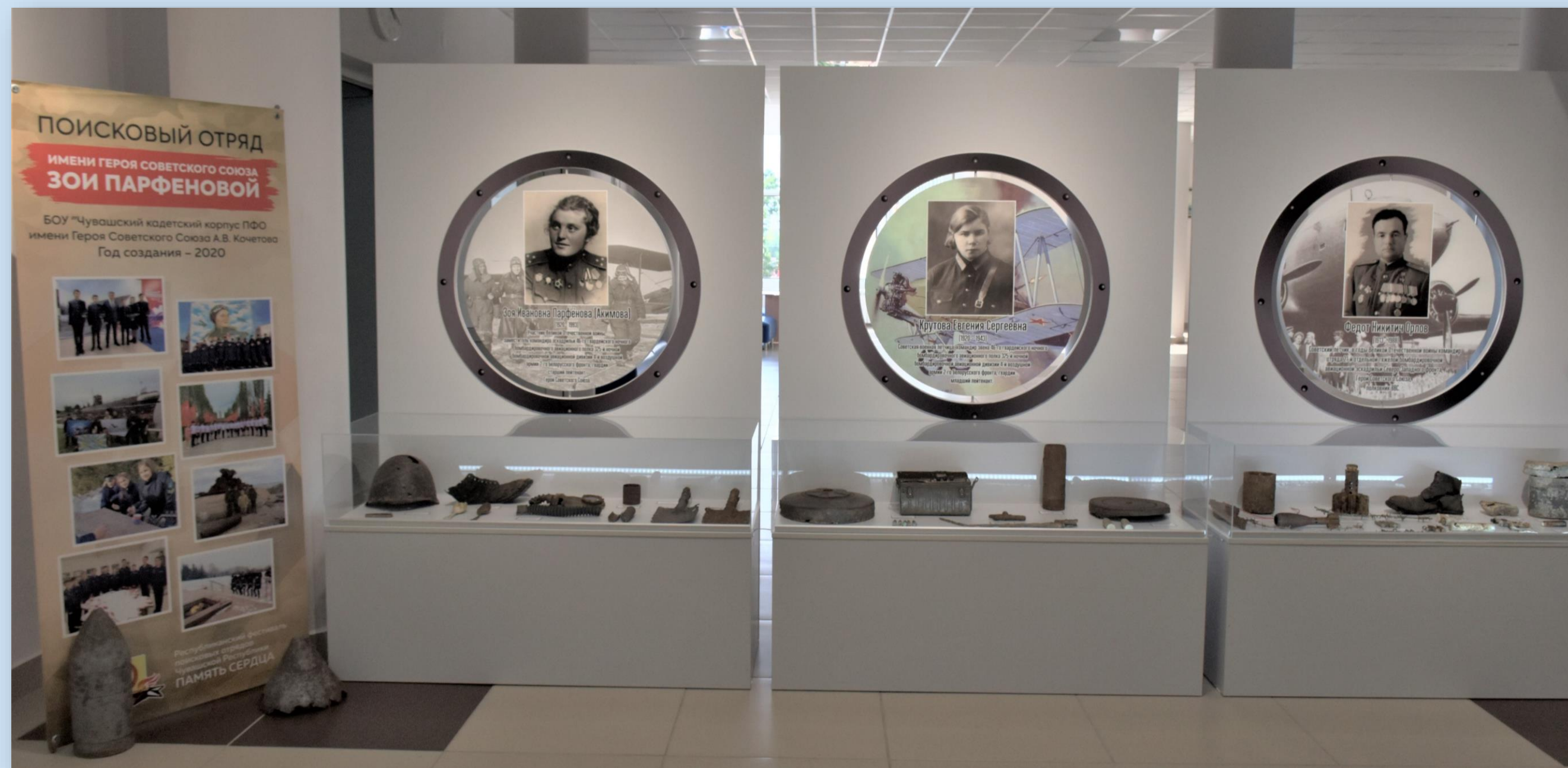
Поисковый отряд имени Героя Советского Союза Зои Парфеновой