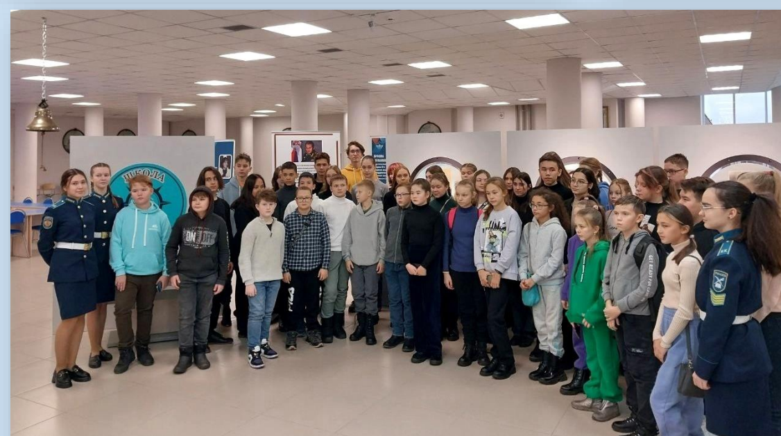
Участники социального тура «Открой свою Чувашию»