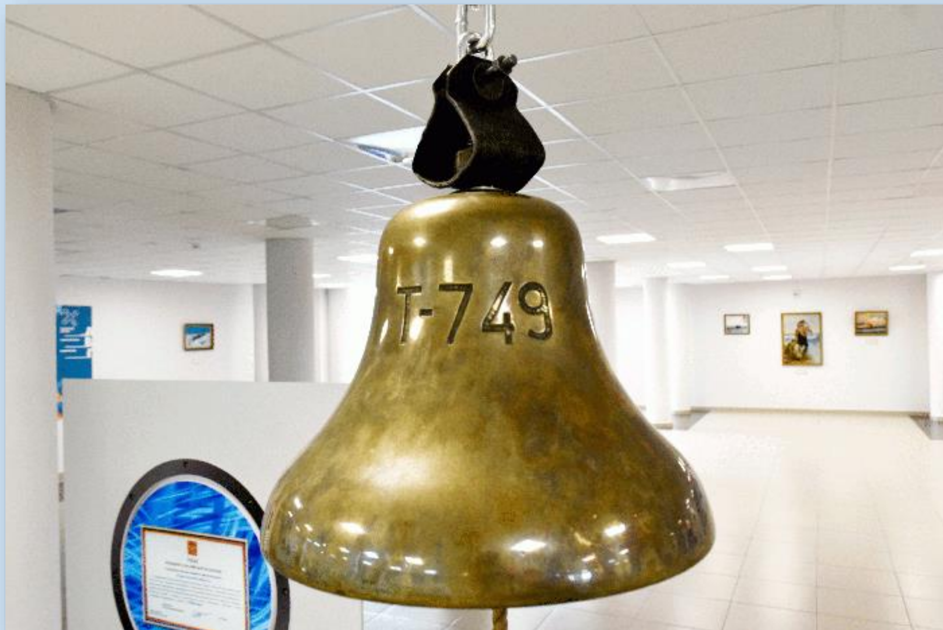
Рында «Т – 749»