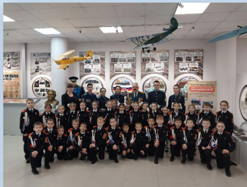
МБОУ «СОШ № 37» г. Чебоксары