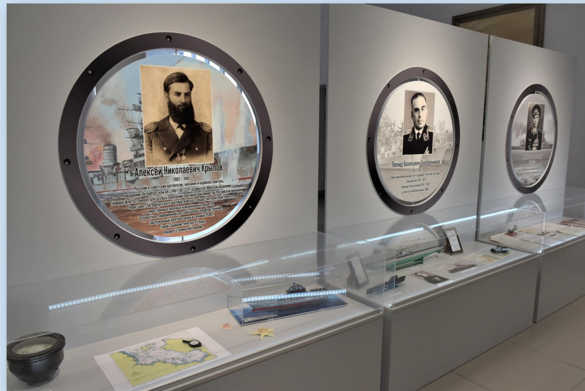
История развития авиации и флота России