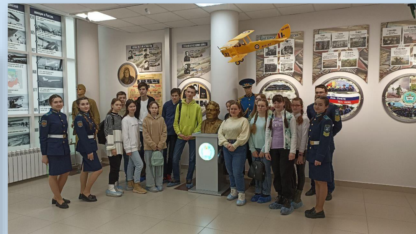
Интерактивная площадка Открытия года счастливого детства