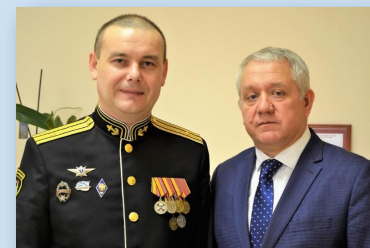
Юрий Исаев Ректор Чувашского республиканского института образования