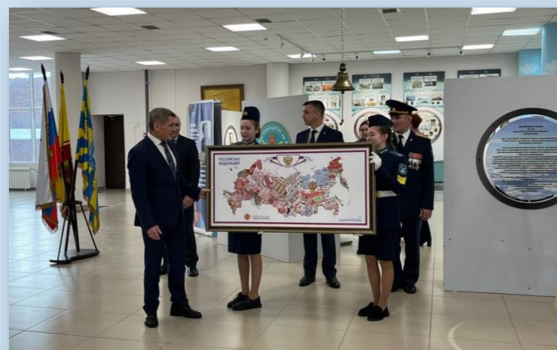
Олег Николаев Глава Чувашской Республики