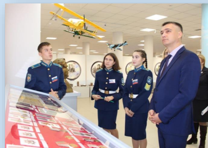
Дмитрий Захаров Министр образования и молодежной политики Чувашской Республики