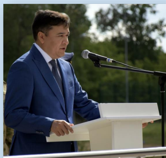
Григорий Сергеев Главный Федеральный инспектор по Чувашской Республике