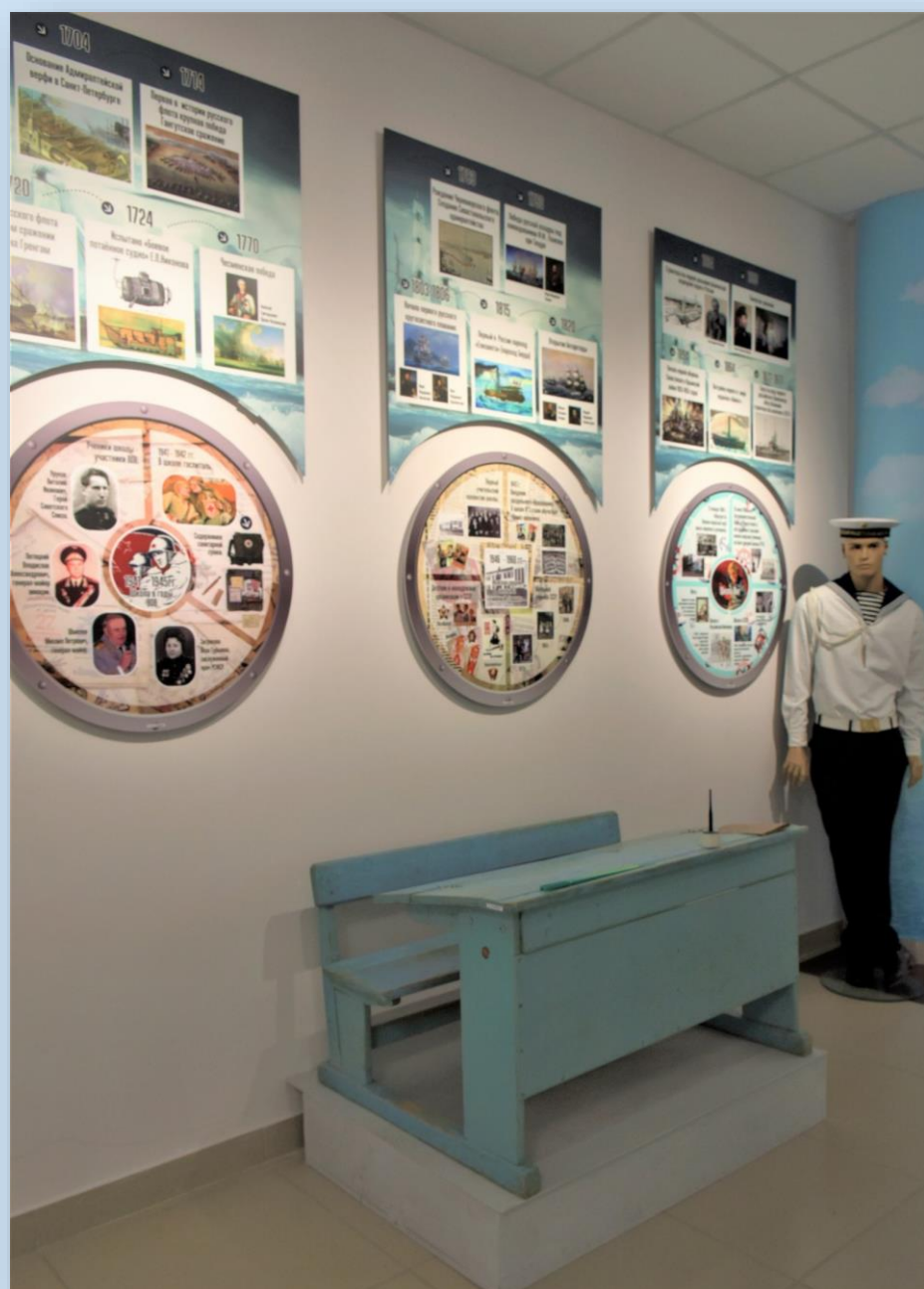
История развития корпуса