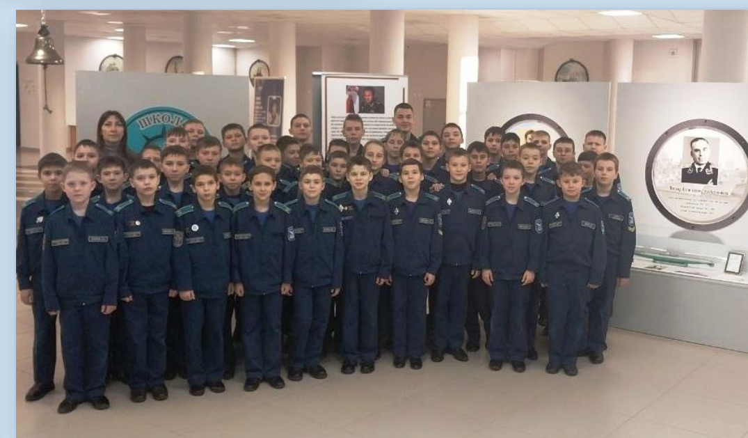
БОУ «Чувашский кадетский корпус ПФО имени Героя Советского Союза А.В. Кочетова»