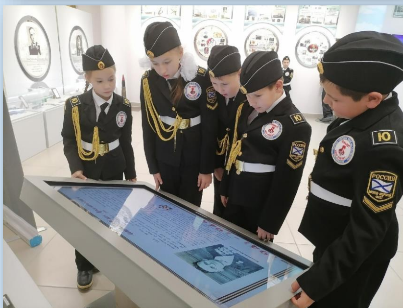
МБОУ «Комсомольская СОШ № 1»