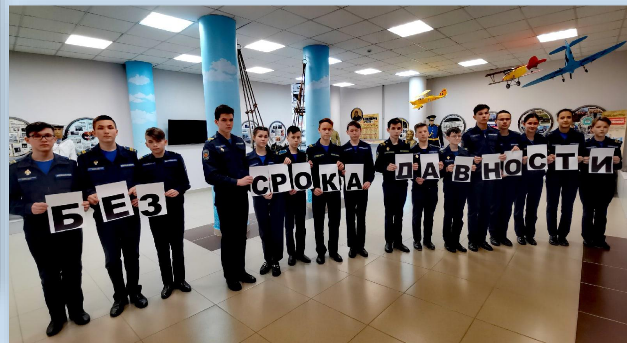
Уроки Мужества, Уроки Памяти